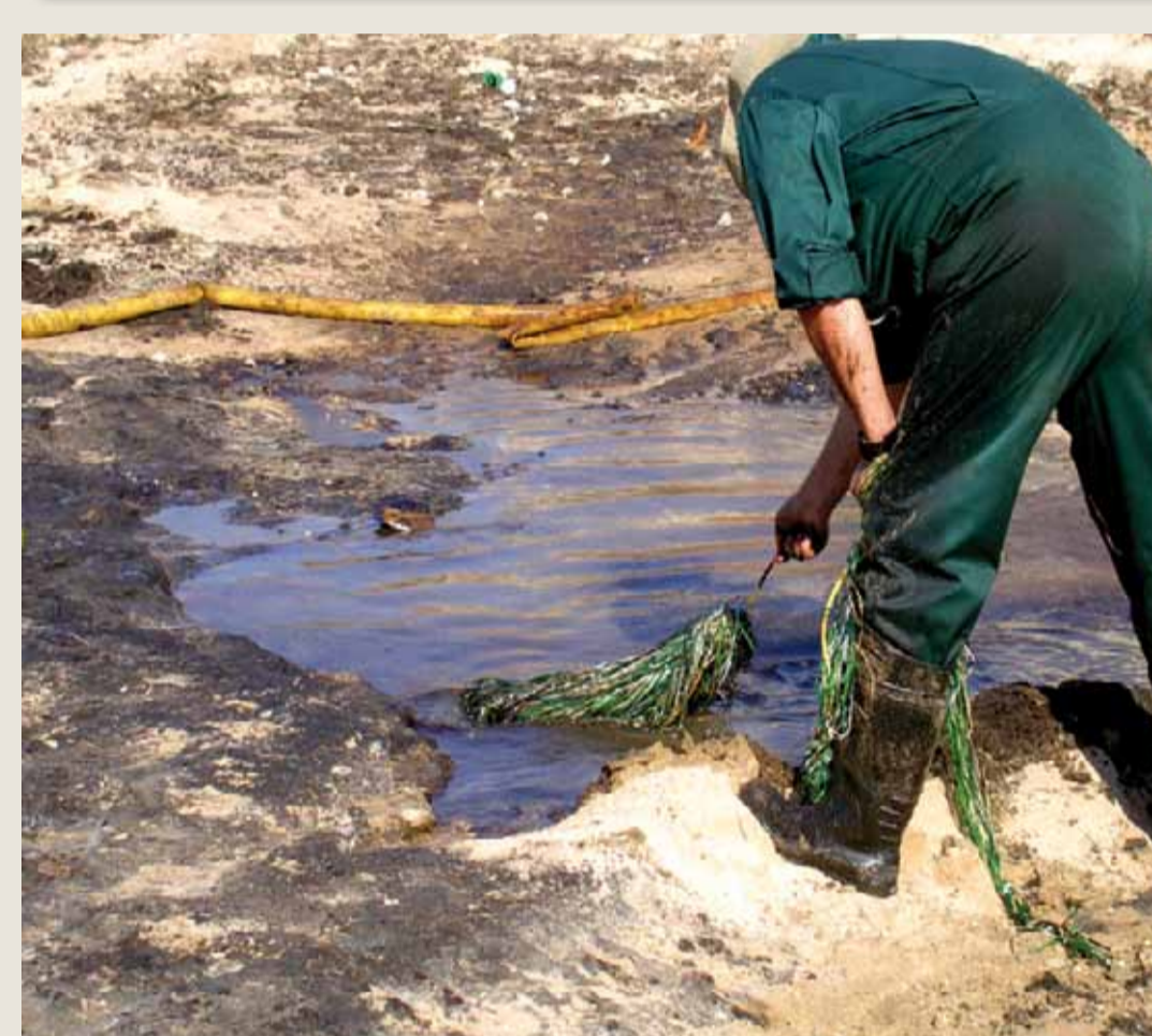
Utilizzo di materiali assorbenti