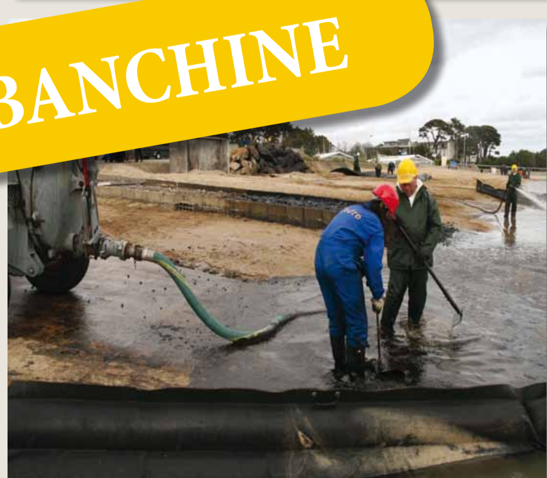
Pompaggio degli idrocarburi fluttuanti