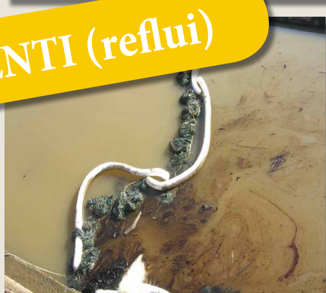
Materiali assorbenti / barriera