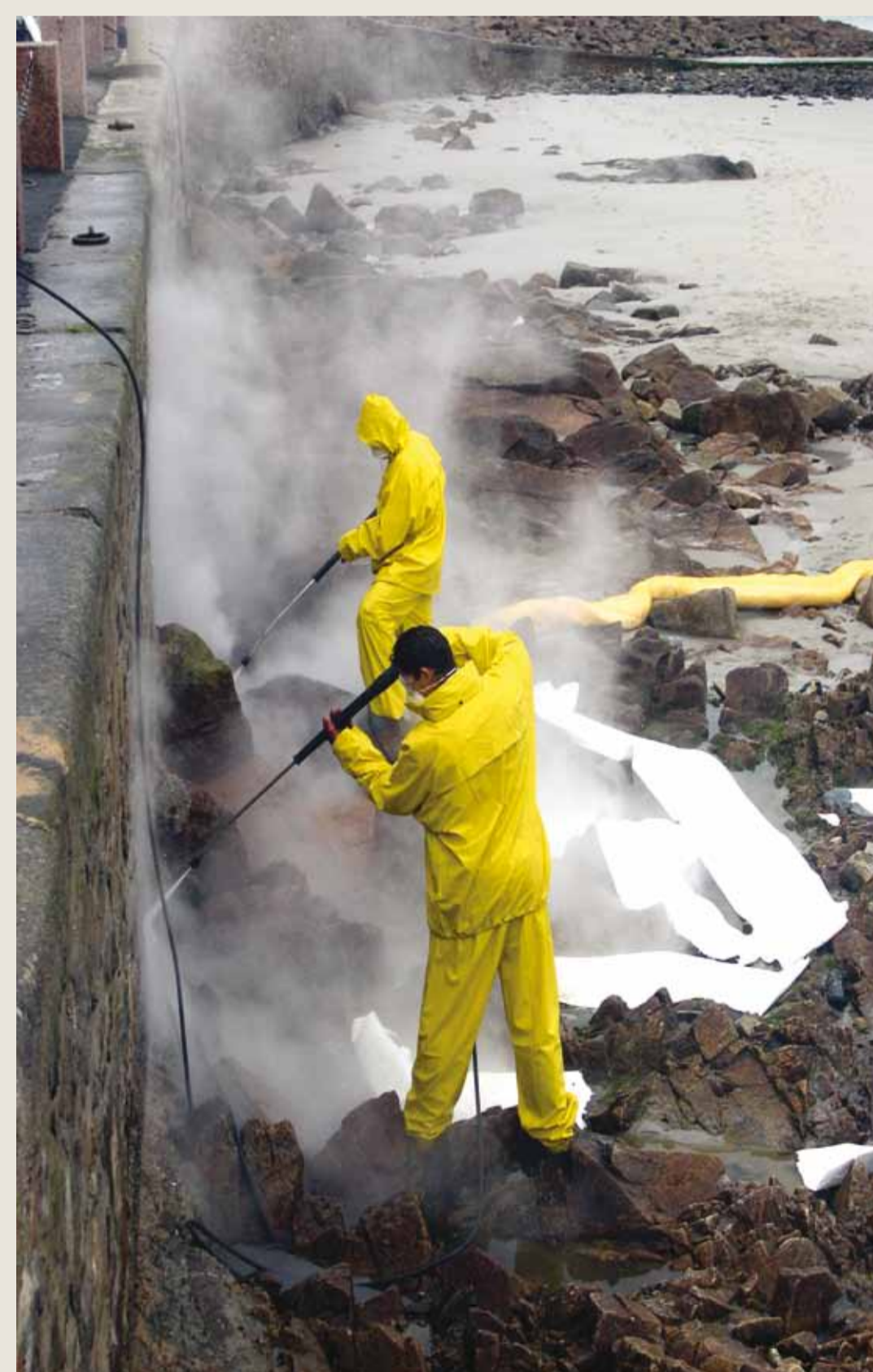
Pulizia ad alta pressione