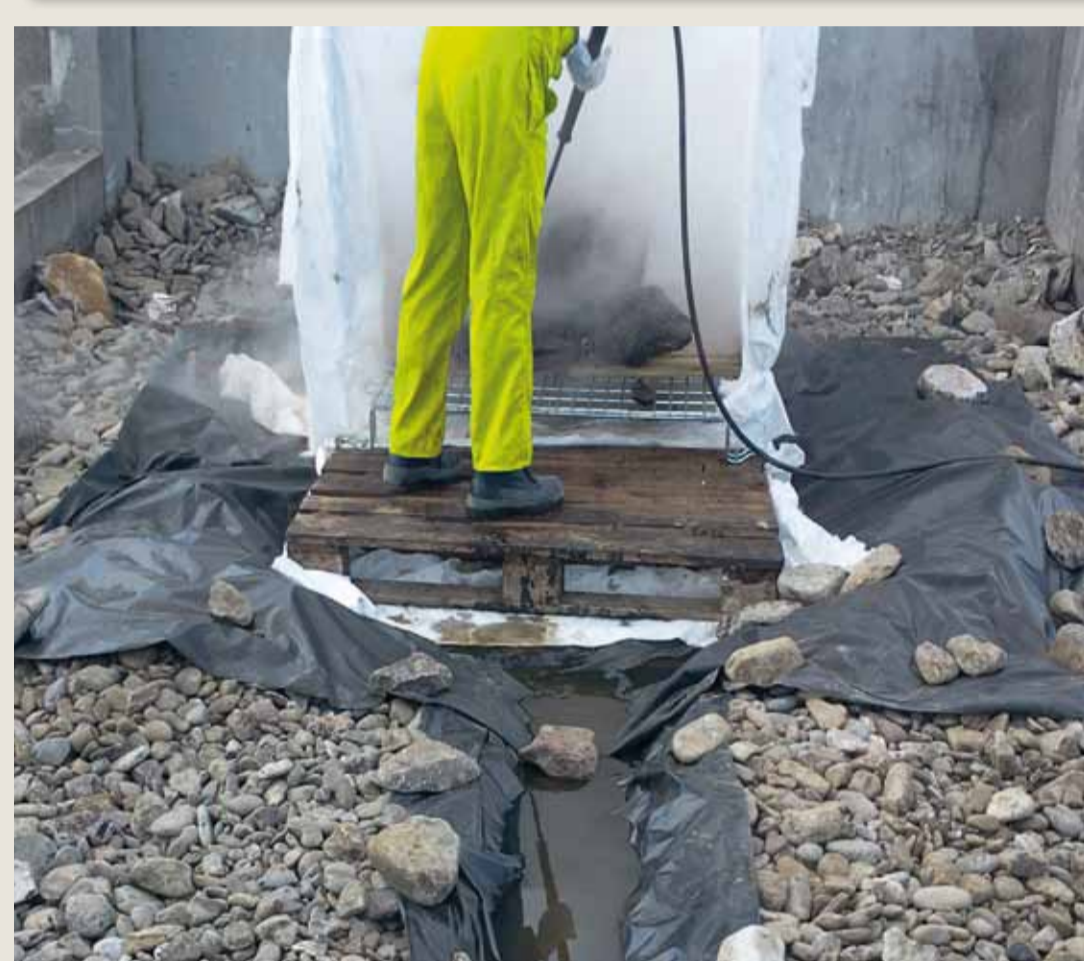
Gabbia di pulizia