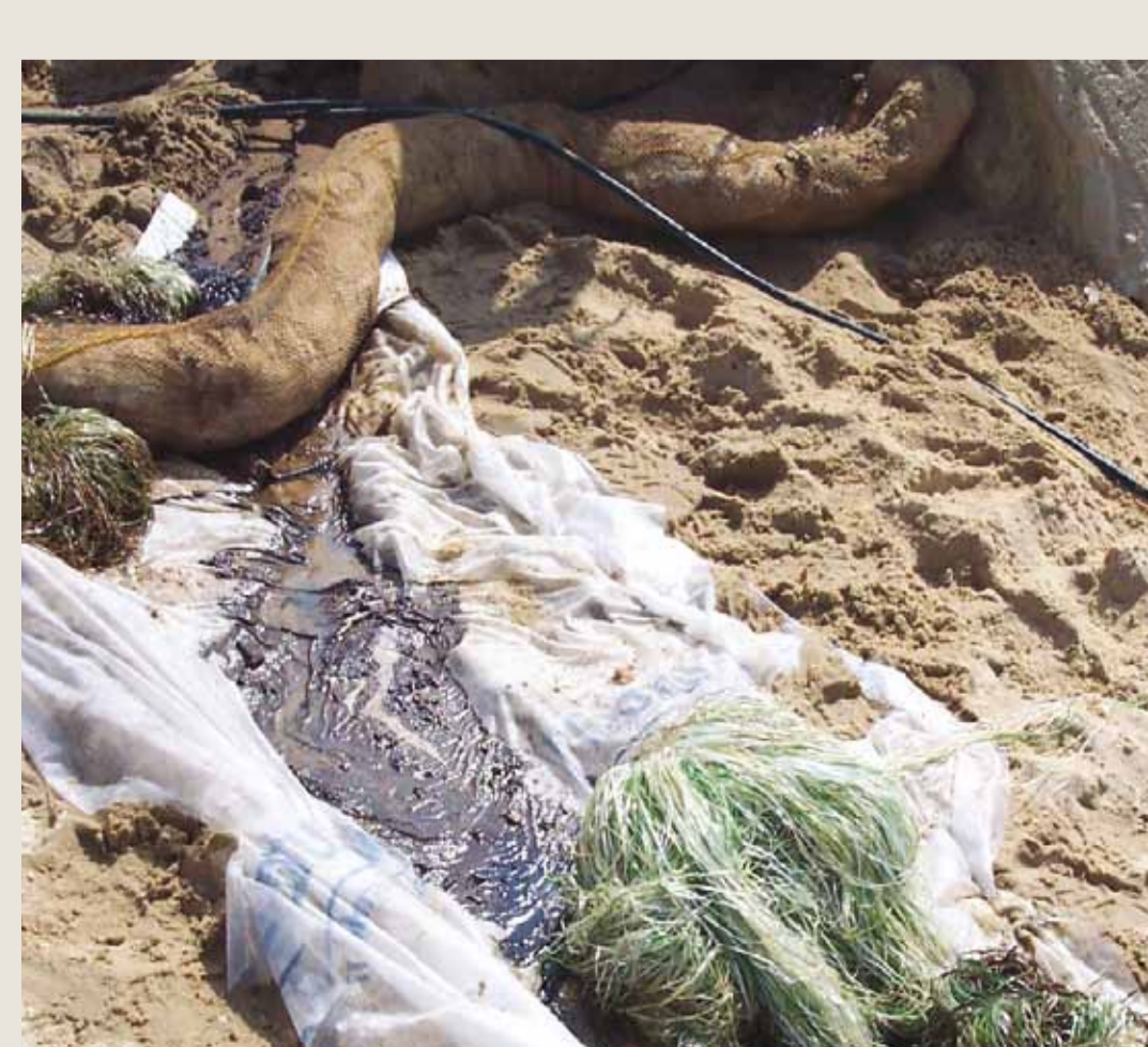
Materiali assorbenti / filtraggio