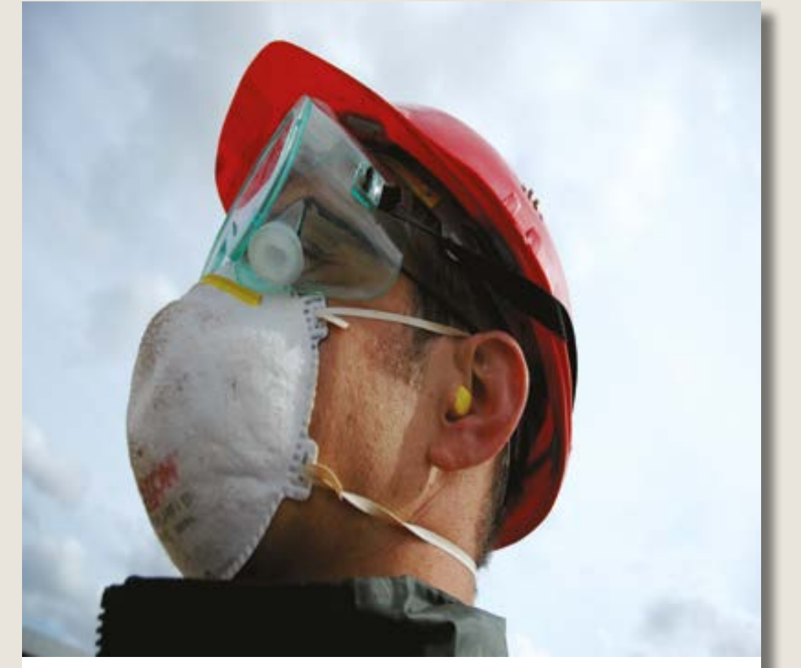
Baş, kulak ve yüz