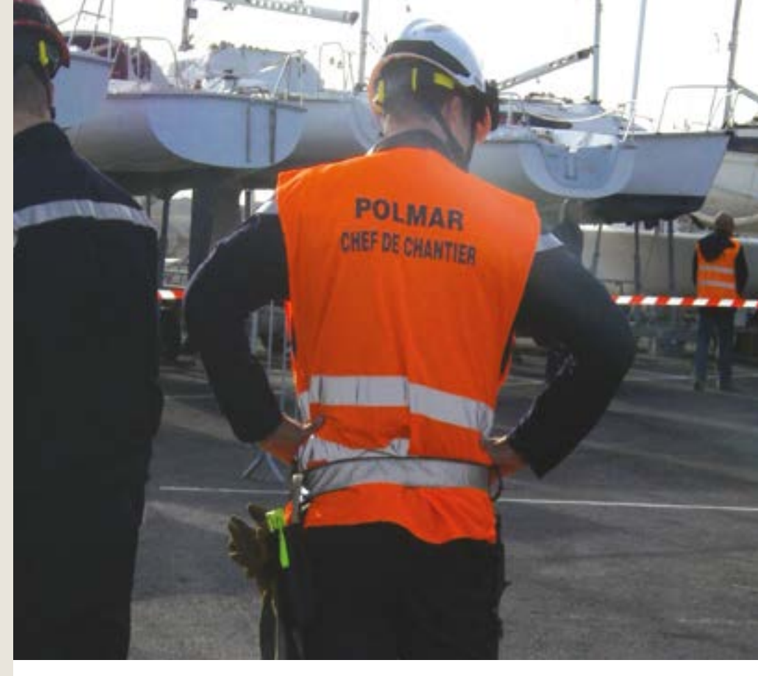
Görev ve Sorumluluklar

Roller, uyarı zinciri, acil durum eylemleri, bilgilendirme toplantısı, eşleştirme sistemi