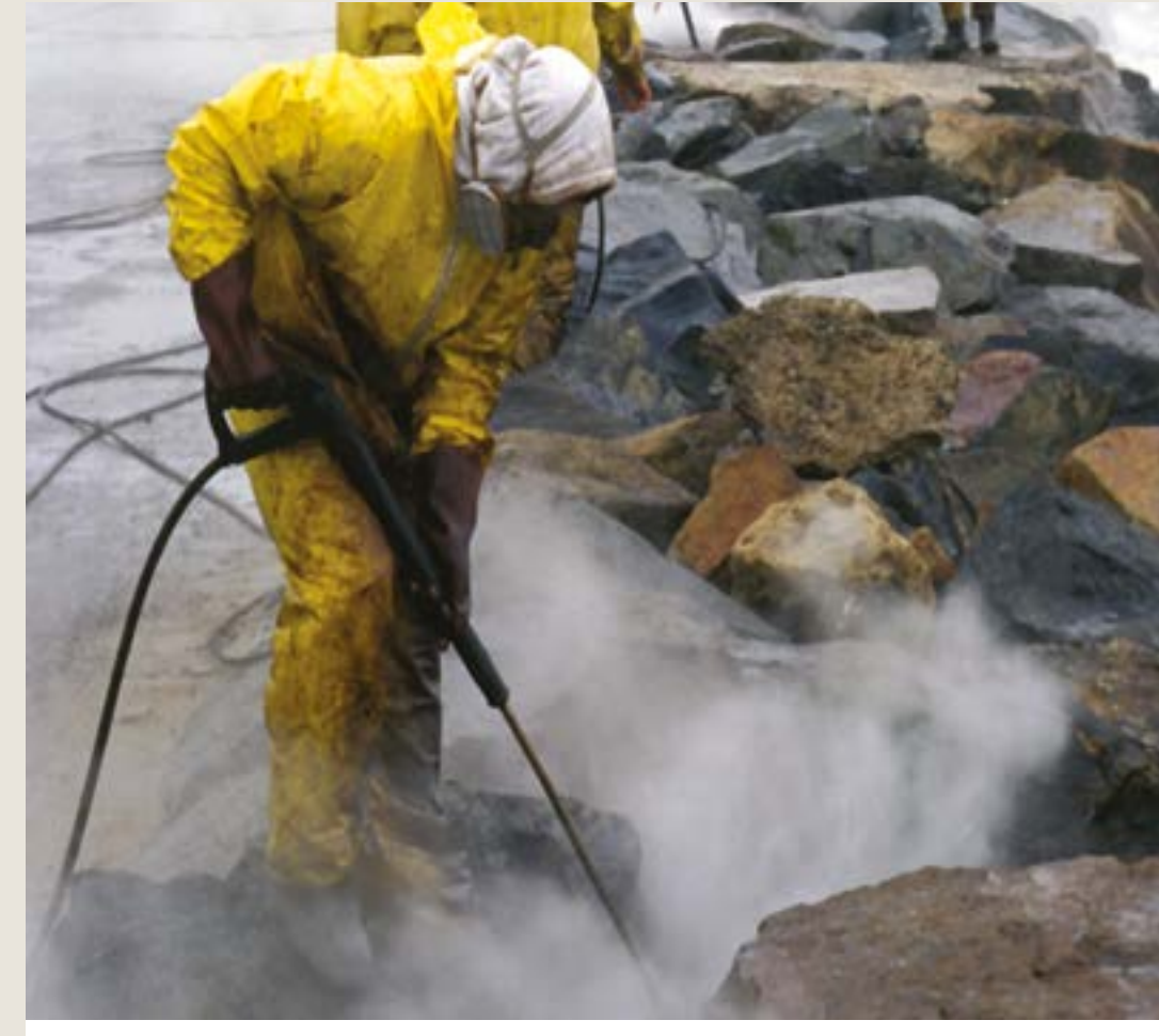
Yüksek basınçlı yıkama