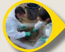
Petrol ile Kirlenmiş Kıyı Şeridinin Temizlenmesi