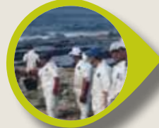
Petrol Döküntüsü Gönüllü Yönetimi